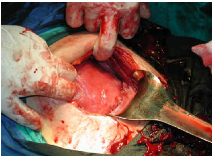
Slika 2. Sutura materice po modifikaciji Misgav Ladach